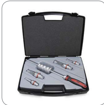
TMIP 7-28 4個のエクストラクターで 内径7m/m~28m/mまで対応