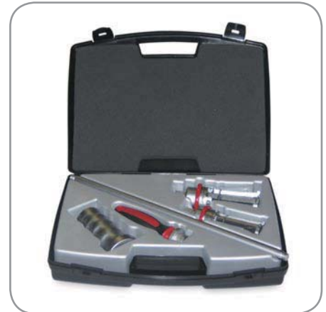
TMIP30-60 2個のエクストラクターで 内径30m/m~60m/mまで対応